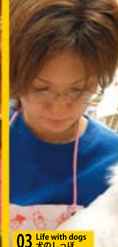
03 Life with dogs 犬のしっぽ