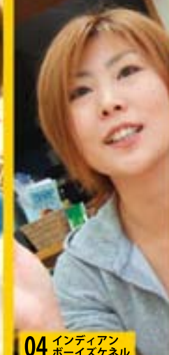
04 インディアンボーイズケネル