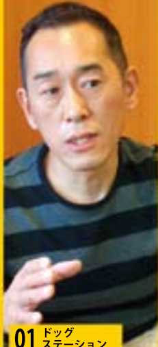
01 ドッグステーション