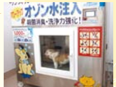
撮影協力/ジョイフルAK屯田店 ペットワールド

画期的なワンちゃん用全自動シャンプーマシーンは、安全性を第一に考えて稼働しているので初めてのわんこでも大丈夫! 機械の中で使われるシャンプーは低刺激性の物を使用、耳への水侵入防止に防水性の綿を用意しています。シャワーの温度も35°C、乾燥も35°Cなので、マシーンの中はワンちゃんはもちろん、「人間」が入っても快適なんです!