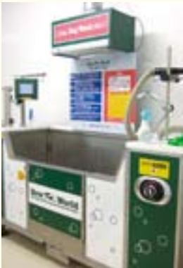
撮影協力/パウワールド

最近のシャンプーの形態も、トリミング店によって様々なものがあります。 「試してみたいけどどんなものかよくわからない…」スタッフに相談して、愛犬に良いと思う新しいスタイルを探してみましょう。