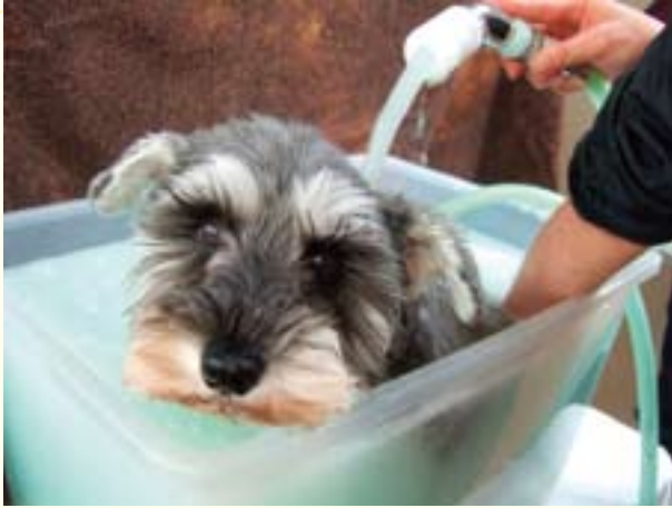
撮影協力/インディアン ボーイズ ケネル