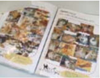
▼お泊りしたワンちゃんの「お泊りダイアリー」のプレゼントも嬉しいサービス♡

Point! 広い店内で1日のびのび遊べる お店のオープン時から閉店までお外で自由♪ 店内の広々空間でのびのび遊んでお昼寝しましょ☆