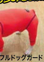
フルドッグガード