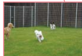
インディアンボーイズケネル (真栄店) 国 札幌市清田区真栄4条2丁目17-36 ☎ 011-889-5767