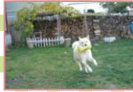
dog'cafe 木夢 2 国 札幌市北区新川西1条6丁目6-6 ☎ 011-577-6550