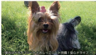
「車内はドッグシートとおしっこシート完備!安心ドライブ!!」

家族の一員のわんこ。車でしか行けなかったあんな場所やこんな場所!に「バス」で行けるんです!!多くのわんこ飼主様と一緒になので交流を深めながら、今までになかった新しい旅へ!6～7月のツアー-募集中!お申込み、お問合せお待ちしております。