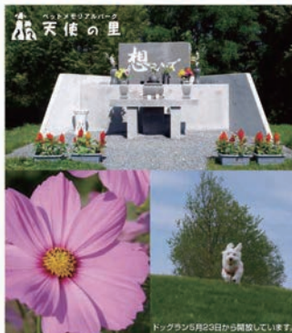
ドッグラン6月23日から開放しています。